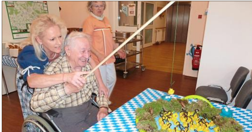
Für die Bewohner gab es lustige Spiele.