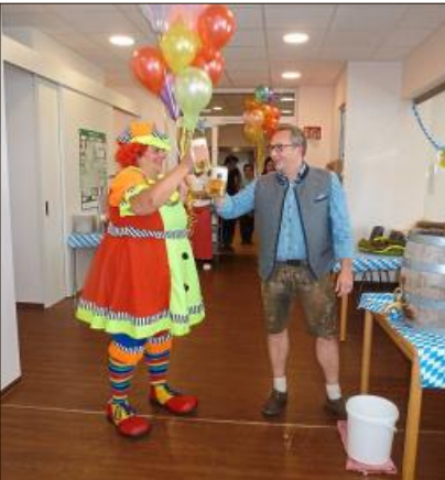
Prost auf ein gutes Gelingen.

Allmählich trauten sich einige Heimbewohner, ihr Geschick an den Spielständen zu testen und freuten sich dann über die kleinen Preise, mit denen sie belohnt wurden. Für alle war das Fest ein schönes Erlebnis und brachte Abwechslung in den Heimaltag.